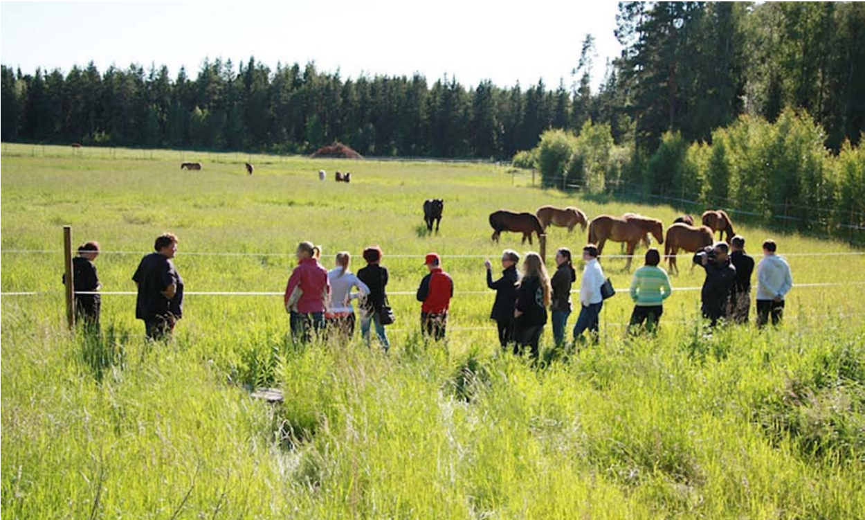
▲ Talli PuoliSata -kimppatallin jäseniä laiduntreffeillä. Tallin kahdella nuorella suomenhevosravurilla on 50 omistajaa.

enemmän kuin muita kotieläintuotantotiloja yhteensä. Yli puolet talleista sijaitsee Etelä-Suomessa. Erittäin kaupunkien ja muiden asutuskeskittymien läheisyydessä olevalla maaseudulla hevostoimintaa on paljon, jolloin hevosten suora vaikutus maaseutuun näkyy selvimmin sekä maisemassa että alueen elinvoimaisuudessa. Laiduntavat hevoset pystyvät pitämään kunnossa laajoja alueita, joita ei käytetä ruuantuotantoon ja jotka muutoin saattaisivat pusikoitua ja avoimet peltomaisemat kadota. Näin hevosilla on selkeä vaikutus luonnon ja maiseman monimuotoisuuden sekä kulttuuriympäristöjen ylläpitämisessä.