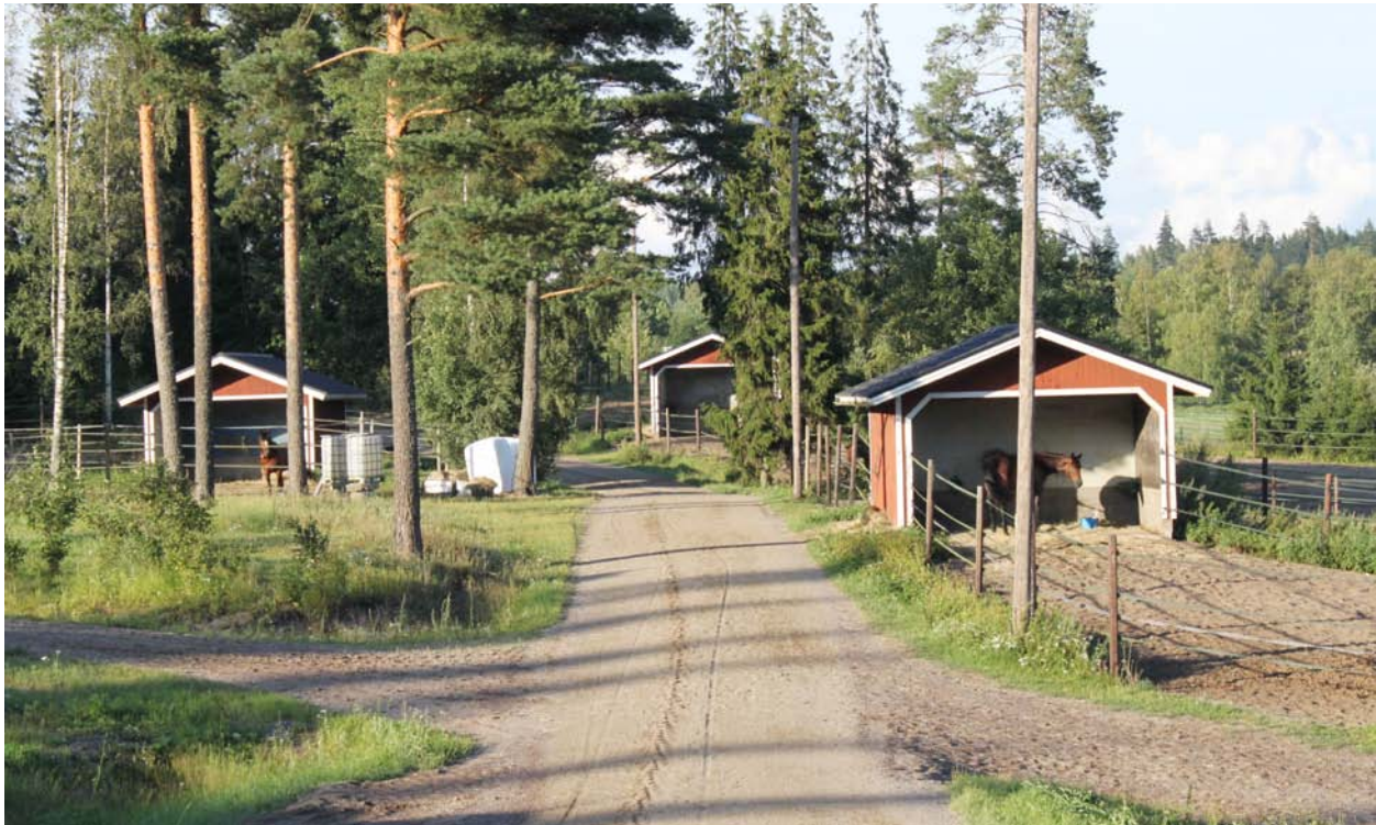
▲ Maatalouden rakennemuutoksessa hevostalouden on yksi maaseudun uusista ja kasvavista yritysmuodoista. Kuvassa Väreän hevosmila Viidissä.

Ostopalveluiden lisäksi yritysten välinen yhteistyö luo mahdollisuuksia maaseudulla. Esimerkiksi matkailu-,