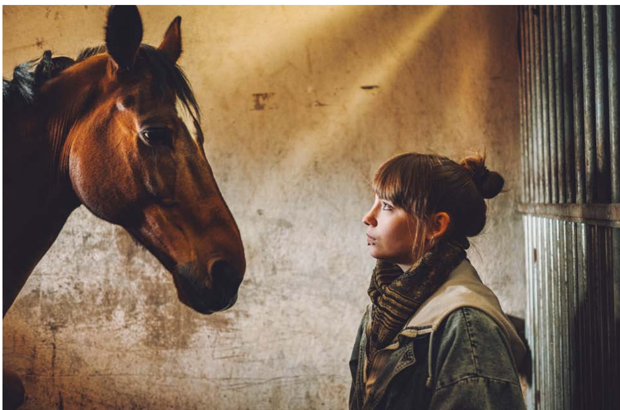
▲ Hevonen on kehon kieltä lukeva laumaeläin.